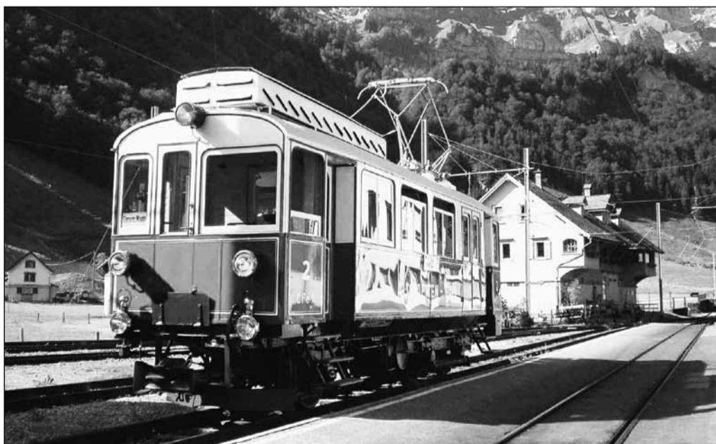
Zum Kino in Wasserauen werden fast hundertjährige Nostalgiezüge zum Einsatz kommen.

Folgende Filme stehen auf dem Programm: Freitag, 20. August, «Hinter den sieben Gleisen»: